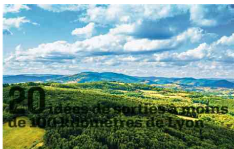
Vue du paysage du Beaujolais, labellisé Geoparc mondial Unesco.

Sur le papier, pouvoir circuler dans un rayon de 100 kilomètres seulement depuis son domicile ne faisait franchement pas rêver. Pourtant, à 100 kilomètres à vol d'oiseau de la place Bellecour, les possibilités de s'évader sont en fait presque infinies. Tribune de Lyon a sélectionné pour vous 20 idées d'escapades nature, en famille, sportives, culturelles ou encore gastronomiques aux quatre coins de notre région, dont la diversité des paysages n'est plus à prouver. De quoi s'oxygéner les méninges après deux mois frustrants de confinement.