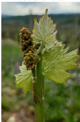
Future vendange de Chardonnay