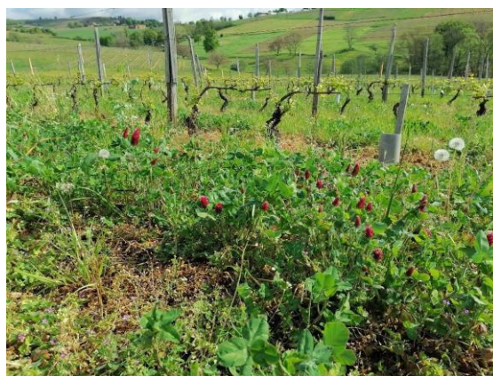
Engrais vert : trèfle incarnat !