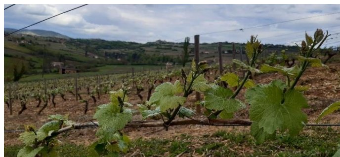
Evolution du développement végétatif sur un pied de gamay