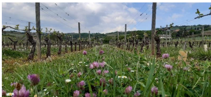
La biodiversité ancré dans notre vignoble : engrais vert de trèfle violet