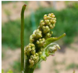
Stade 09 : 4-5 feuilles étalées