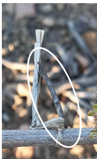
Chenille boarmie ( Boarmia gemmaria )