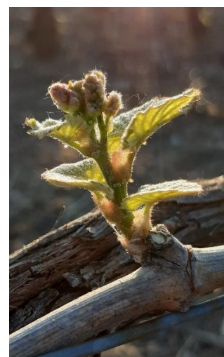
Stade 09 : 2-3 feuilles étalés avec futures grappes visibles