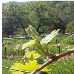
Stade 09 : 2-3 feuilles étalées