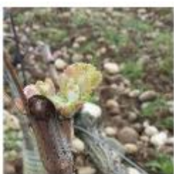
Stade 07 : 1 ère feuille étalée