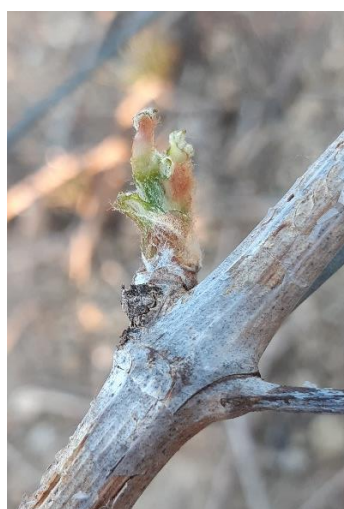
Bourgeons éclatés et grignotés...